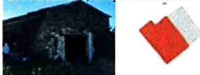
La Jousandière, Chapelle du Genêt

Le projet de changement de destination de La Bouguinière (p 73 et suivantes), à Jallais est situé quant à lui a priori à proximité de bâtiments agricoles d'élevage. Si le site n'est pas répertorié comme siège d'exploitation, la refonte récente des bâtiments et les terrassements en cours (cf vue aérienne) semblent indiquer que l'activité existe toujours. Si au contraire les locaux ne sont plus en activité agricole, en favorisant l'implantation de nouveaux habitants par ce changement de destination, le retour à l'activité agricole deviendrait impossible d'une part et les anciens bâtiments d'élevage deviendront des friches non traitées à terme. Le choix de l'identification ne semble de fait pas pertinent.