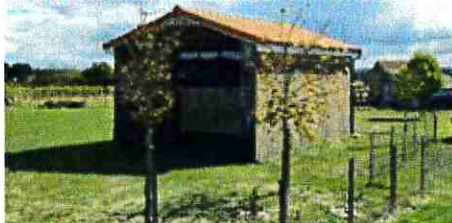
La Bretonnière vue actuelle

Le site de la Jousandière à la Chapelle du Genêt, (pp 65-68) présente le même défaut de taille minimale dans la mesure où une partie de l'emprise projetée correspond à un appentis non clos ; le bâtiment concerné est d'ailleurs indiqué graphiquement sur une partie seulement de l'emprise totale.